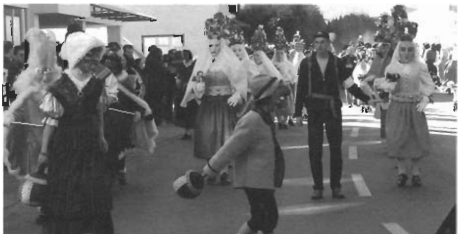
Die Singesler-Paare zogen, flankiert von zahlreichen Zuschauern, ins Unterdorf.