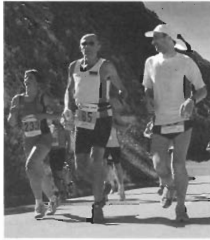
Der Marathon lockt heuer zum 2. Mal.

Wer beim Auftaktlauf dabei war, weiß, dass es hierbei nicht um Bestzeitenjagd, Bezirks- oder Nationenrekorde und Meisterschaftsmedaillen geht, sondern die Marathoni auf dem Weg von Mandarfen am Fuße des Gletschers in die Bezirkshauptstadt Imst ein einzigartiges, malerisches Landschaftspanorama laufend genießen können. Viel Zuspruch dürften neben dem Marathon auch der für 4 Teilnehmer ausgeschriebene Staffelmарathon, der Halbmarathon, der 11,4 km lange Hobby- sowie der Kinderlauf erfahren. Während die ersten „schnellen Hirsche“ schon bald die Halbmarathonmarke erreichen, machen sich in Wennis vor dem Gemeindezentrum die Halbmarathon- und Hobbyläufer warm für ihr Rennen, das sie ab 10.30 Uhr eben-