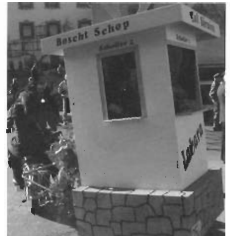
Ein eigenes „Postauto“ versorgte die Zuseher mit der Labera-Zeitung.