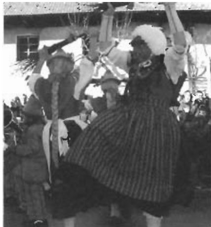
Die Walder Hexen führten ihren Hexentanz auf.