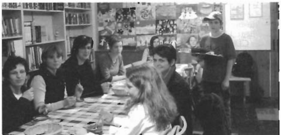
Dank gebührt allen, die beim Fastensuppenausgeben mitgeholfen haben.