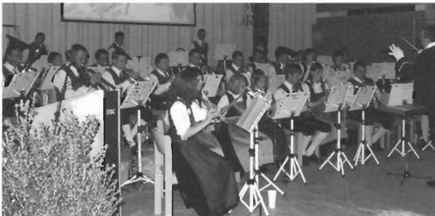
Die Musikkapelle Arzl lädt am Ostersonntag zum Frühjahrskonzert.

kann mit Märschen, Ouvertüren, und moderner sowie symphonischer Musik ein umfangreicher musikalischer Geschmack abgedeckt werden. Die Musikkapelle Arzl lädt alle Musikbegeisterten aus Nah und Fern ein, an ihrem musikalischen Höhepunkt des heurigen Jahres teilzuhaben.