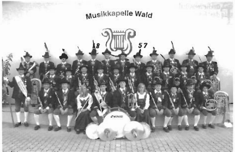
Die Musikkapelle Wald hat heute 150 gute Gründe zum Feiern.