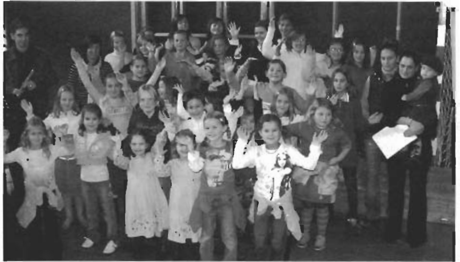
Die Kinder sind mit Feuereifer bei der Sache.

Ein großer Teil der Arbeit für uns Musikpädagogen ist es, von Jahr zu Jahr neue Schüler für die Musikschule zu begeistern. Dies ist ohne die breite Öffentlichkeit sowie Unterstützung der Vereine und der Eltern kaum möglich. In den vergangenen Jahren konnten wir Neuanmeldungen noch im September akzeptieren, das wird in Zukunft nicht mehr möglich sein. Wir setzen daher die Frist für die Neuanmeldungen mit 30. Mai fest. Da der Andrang bei gewissen Instrumenten – Gitarre, Keyboard – sehr groß ist, werden hier Neuaufnahmen kaum möglich sein. Daher ersuchen wir um die Bereitschaft, die Kinder zu anderen Instrumenten zu motivie-