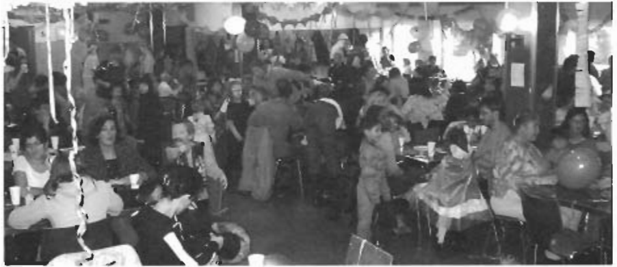
Im Gemeindesaal gings heuer bunt zu.

Am 20. Jänner veranstaltete die SPG PITZTAL mit Hilfe der Eltern unserer Nachwuchskicker der Jahrgänge 1998 – 1996 ein tolles Faschingsfest. Zahlreiche Besucher aus den Gemeinden Arzl, Wenzers und Jerzens ließen den Gemeindesaal „aus allen Nähten platzen“. Durch die großzügige Unterstützung der Raika Arzl, Sparkasse Arzl, der Firmen Stoll Wohnen und Fliesen Jäger sowie den vielen fleißigen Kuchenspendern konnte die Bewirtung sehr kostengünstig erfolgen und familienfreundlich gestaltet werden. Alle Getränke, Kaffee und Kuchen gab es für nur € 1,-. Auch die große Tombola mit 150 kindgerechten Gewinnen war ein voller Erfolg. Dank auch hier an alle Spender der Sachpreise. Für die musikalische Unterhaltung sorgte kosten-