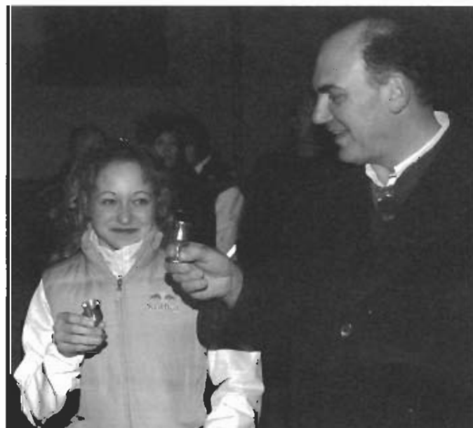
Ein Schnapsel in Ehren mit dem Landtagsabgeordneten Hannes Staggl konnte auch Angie nicht verwehren.

Die Freiwillige Feuerwehr Arzl bedankt sich bei der Bevölkerung für die zahlreichen Spenden anlässlich der Haussammlung 2007.